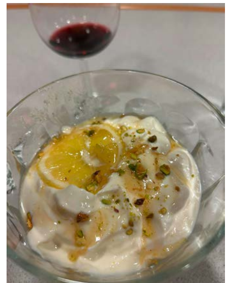
Als Nachspeise gab es eine leicht zuzubereitende Zitronencreme aus Zitronen, Sahnejoghurt, Topfen und Honig.

Wir wünschen ein gutes Gelingen und guten Appetit. Möge es Ihnen genauso gut schmecken, wie es uns geschmeckt hat. ■