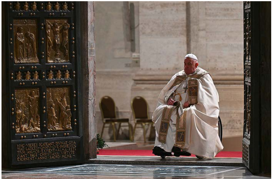
Der Tradition folgend, öffnete Papst Franziskus am 24. Dezember 2024 die Heilige Pforte im Petersdom, seitdem kann sie von Pilgern durchschritten werden.

Gute Werke – Zeichen der Hoffnung: Über diese äußeren Zeichen des Jubiläums hinaus lädt Papst Franziskus dazu ein, verschiedene Zeichen der Hoffnung wiederzuentdecken. Unter den vielen Zeichen der Zeit, für die während des Jubiläums gebetet werden soll, erinnert er an die Hoffnung auf Frieden in der Welt, die Offenheit für das Leben durch verantwortungsvolle Mutter- und Vaterschaft, die Nähe zu so vielen älteren Brüdern und Schwestern, die schwächer und