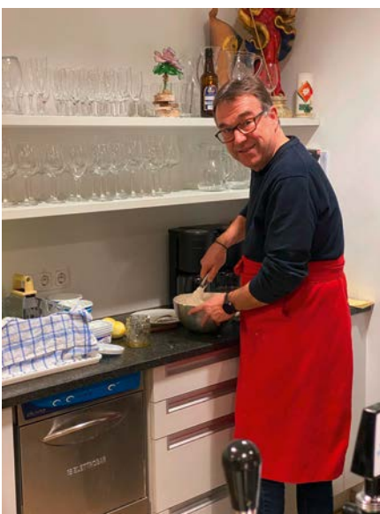
Die Zitronencreme wird zubereitet.

Wir wünschen ein gutes Gelingen und guten Appetit. Möge es Ihnen genauso gut schmecken, wie es uns geschmeckt hat. ■