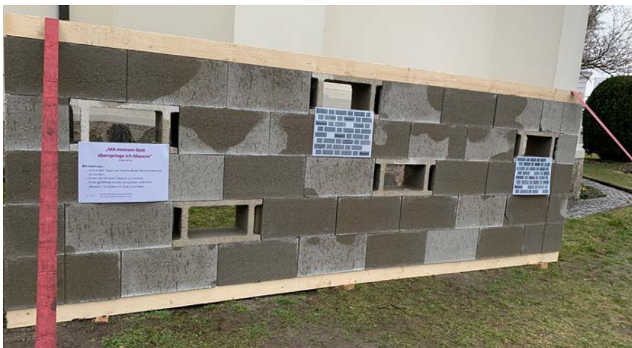
Vor der Trauner Kirche steht seit einigen Woche diese Mauer.

Wir laden ein, sich in den verbleibenden Tagen vor Ostern dieser Mauern bewusst zu werden. Hinter die (Kirchen-)Mauer zu schauen, in die geöffnete Kirche einzutreten und seine »Mauern« im Gebet vor Gott zu bringen.