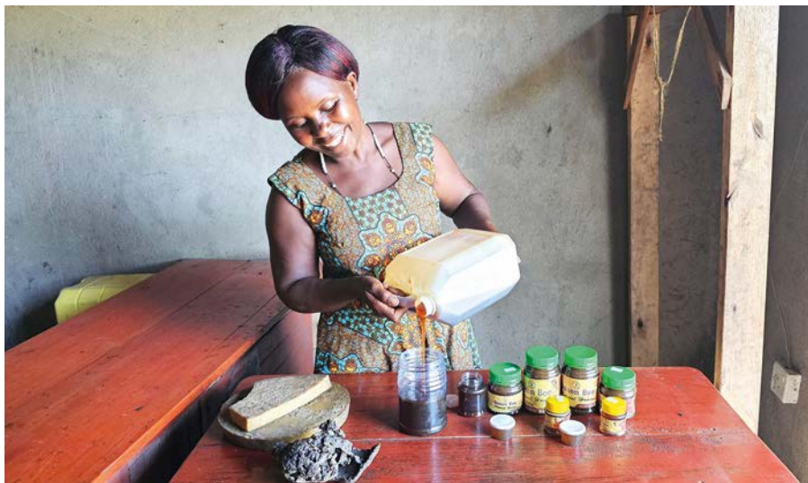
Die Aktion »Sei So Frei« unterstützt ein Imkereiprojekt in Uganda.

Mit dem Verkauf von einem Kilogramm Honig nimmt eine Familie so viel ein, wie ihr in extremer Armut