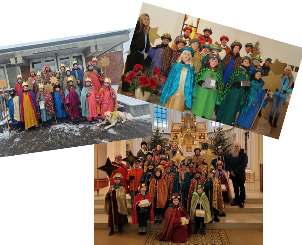
Sternsingergruppen aus St. Martin, Oedt und Traun