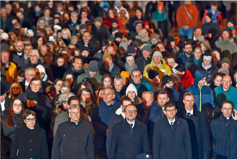
Gedenkmarsch nach dem Terroranschlag in Villach

Auf vielen Ebenen bemühen sich Menschen und Organisationen um die Lösung von Problemen, die durch die oft schwierige Integration entstehen. Die Vertretungen des Islam distanzieren sich ganz klar von einem Missbrauch ihrer Religion durch Terroristen.