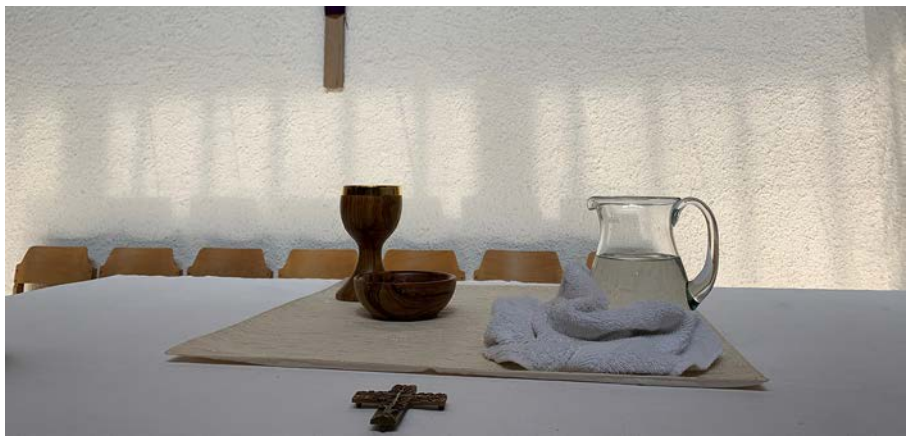
Das letzte Abendmahl und die Fußwaschung stehen Gründonnerstag im Mittelpunkt.

Diese Liebe ist zentraler Inhalt der Botschaft Jesu. Beim Essen mit Freundinnen und Freunden, mit Sünderinnen und Sündern macht er erfahrbar: Ihr