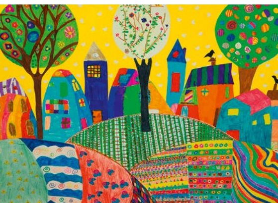
Ostergrußkarten der Jungschar Traun