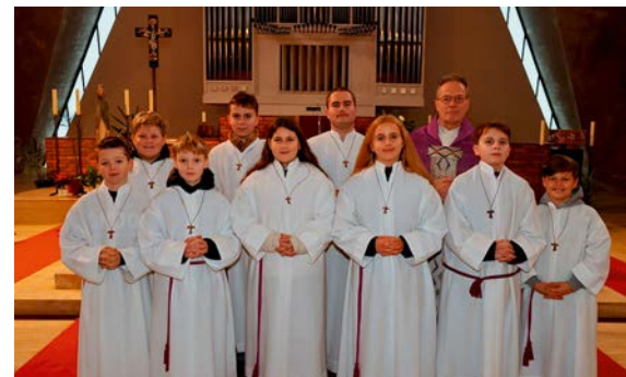
Ministrantenaufnahme in St. Martin