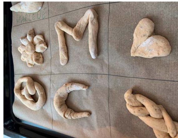
Erstkommunionkinder beschäftigen sich in Intensivworkshops mit dem Brotbacken.

Im Zuge der Vorbereitung feiern wir miteinander Gottesdienst und entdecken den jeweiligen Kirchenraum mit Kinderaugen. Dass Erstkommunion mit der Taufe zusammenhängt, konnten die Kinder beim Fest der Taufe-