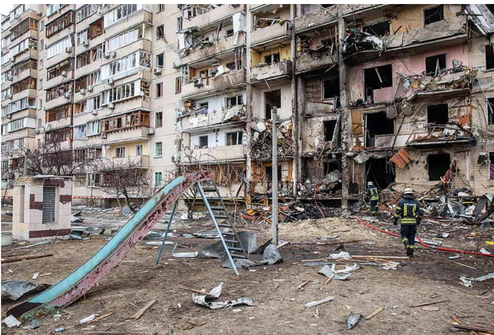
Von der russischen Armee zerstörte Wohnhäuser in Mariupol (Ukraine)