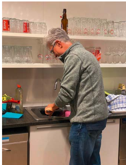
Die Küche saubermachen, macht weniger Spaß als das Kochen.

Vor dem Servieren mit dem restlichen Honig, den Zitronenscheibchen und den geriebenen Pistazien dekorieren.