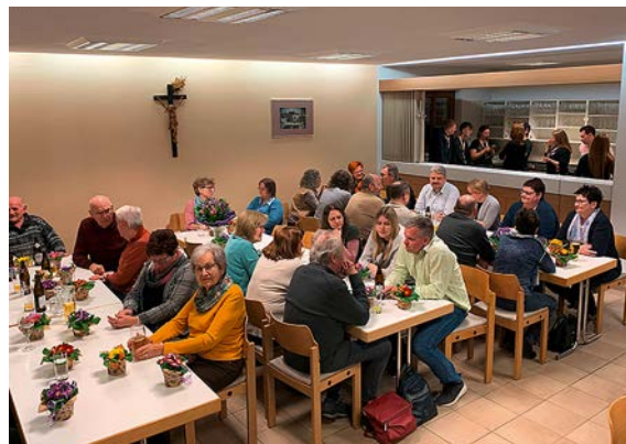
DANKE-Fest für ehrenamtliche Mitarbeiter:innen