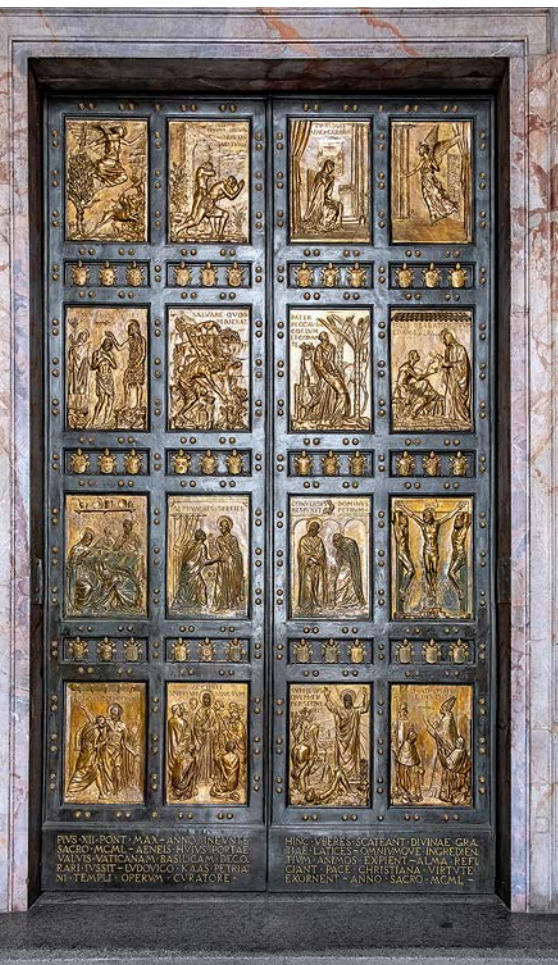
Die Heilige Pforte im Petersdom in Rom

Die Heilige Pforte: Im Jahr 1423 führte Papst Martin V. ein Zeichen für den Beginn des Heiligen Jahres ein: Eine Pforte in der römischen Bischofskirche, die die restliche Zeit verschlossen war, wurde in einem feierlichen Ritus geöffnet als ein Zeichen, dass das Heilige Jahr alle Menschen einlädt, vom Alltag in die Zeit des Festes hinüberzugehen und damit einen neuen Anfang zu wagen. Im Laufe der Zeit wurde der Ritus um Gesten und Zeichen erweitert, fand aber in den letzten Jahren wieder zu einer sehr schlichten und klaren Zeremonie zurück. Das Durchschreiten dieser Pforte hat eine tiefe Bedeutung: Sie soll den Wunsch ausdrücken, Gott zu begegnen, wieder seine Richtung aufzunehmen und erinnert an die Worte Jesu im Johannesevangelium: »Ich bin die Tür. Wenn einer durch mich hineingeht, wird er Heil erfahren; er wird hineingehen und herausgehen und Weide finden.« (Joh 10,9) Die Tatsache, dass der Papst als Erster durch diese Pforte tritt, zeigt nicht seine besondere Stellung, sondern dass auch er immer wieder diesen neuen Anfang benötigt.