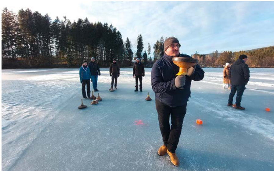
Gemeinsames Eisstockschießen in Ulrichsberg im Mühlkreis

Am Samstagnachmittag verbrachten wir bei sonnigem Wetter ein paar Stunden beim Eisstockschießen. Danach ging es, wie es sich gehört, ins angrenzende Gasthaus, wo es einen zünftigen Schweinsbraten gab. Nach einem lustigen Abend besuchten wir am Sonntagvormittag noch die Villa Sinnenreich in Rohrbach. In zwei Gruppen aufgeteilt, gab es dort viele erstaunliche Eindrücke zu erforschen, die alle unsere Sinne beanspruchten.