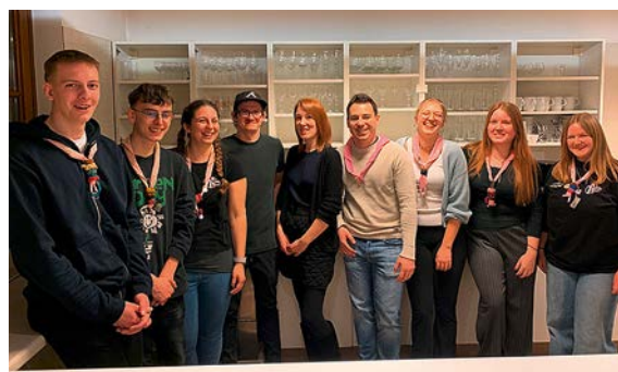
RangerRover (RaRo) der Oedter Pfadfinder unterstützen das DANKE-Fest der Pfarrgemeinde.